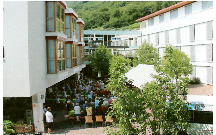
Blick in den Innenhof - links der gelungene Zubau.