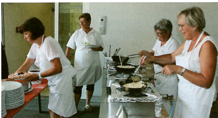
Fleißige Bäuerinnen beim Strauben backen.