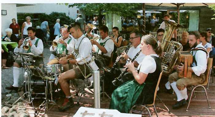
Die Böhmische der Bürgerkapelle Tramin.