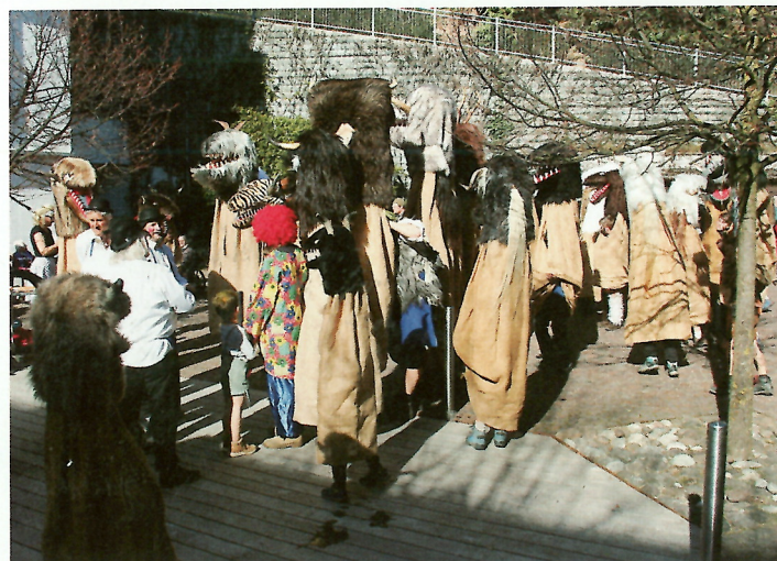
Was wäre der Unsinnige ohne den Besuch der Wudelen?