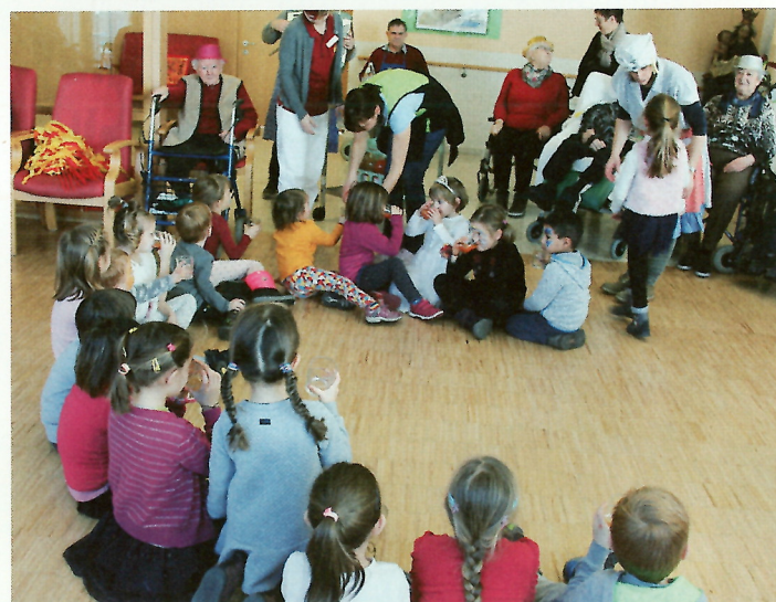
15 Kindergartenkinder erfreuten die Heimbewohner mit einem Besuch.