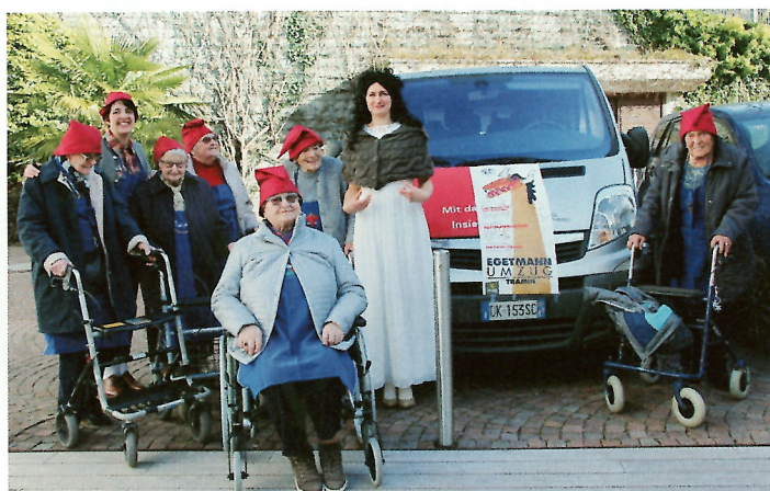
„Schneewittchen und die sieben Zwerge“ starteten zu einem Gegenbesuch in den Kindergarten.