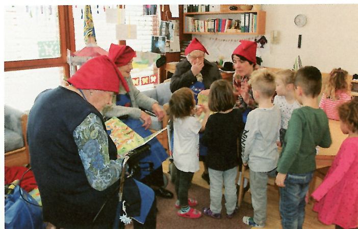
Da gab es vieles zu sehen und zu hören!