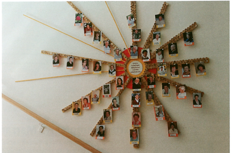
Die Senioren des Altenheimes freuen sich, wenn die freiwilligen Mitarbeiter nach überstandener Corona- Krise schon bald wieder im Haus präsent sein dürfen - nicht nur von der Pinnwand im Eingangsbereich grüßen.